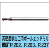
高硬度鋼加工用ボールエンドミル P.202、P.203、P.237

部品表一式で見積り取れないか...そんな時は、 VONAサポートセンターへ ☎0120-343-256