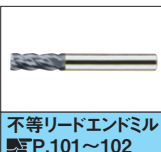
不等リードエンドミル P.101~102

部品表一式で見積り取れないか...そんな時は、VONAサポートセンターへ ☎0120-343-256