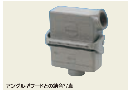
アングル型フードとの結合写真