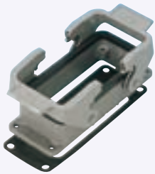
パネル用台座(2レバー式)