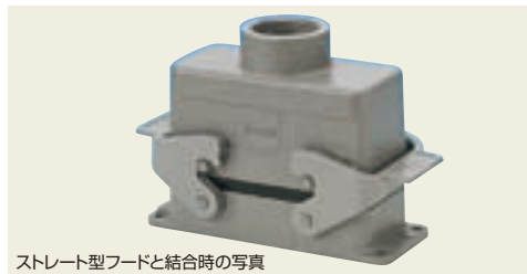
ストレート型フードと結合時の写真