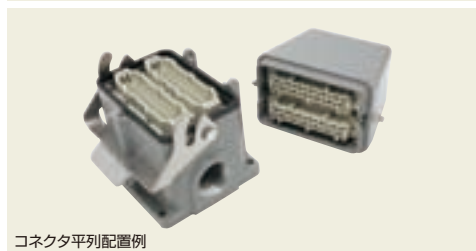
コネクタ平行配置例