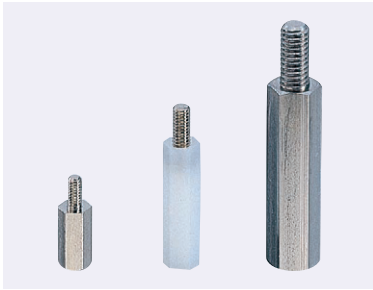
※外観および仕様は、予告なく変更することがあります。