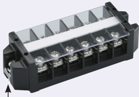
取付ビスは付属します